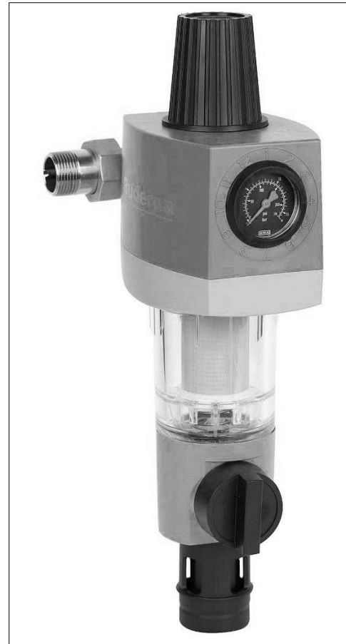
Bild 2: Logafix Wasserfilter mit Anschlussstück und Druckminderer